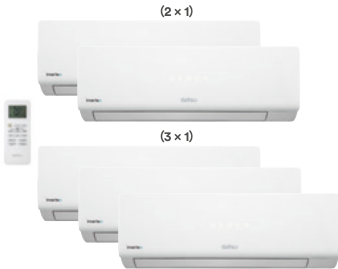
DSM-9KDT-2 / DSM-12KDT-3

8 kg LARGHEZZA 777 mm ALTEZZA 250 mm PROFONDITÀ 201 mm